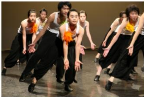
在舞台上學習 舞蹈藝術