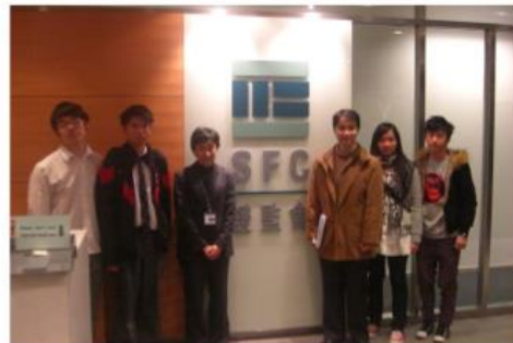
在證鑑會學習 認識金融服務