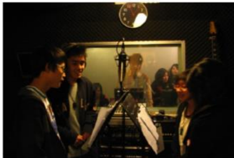
在錄音室學習 電台主持與節目製作