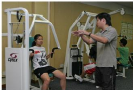
在健身中心學習 運動管理與教練法