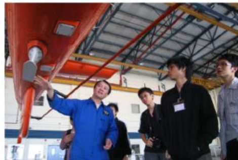
不是紙上談兵 航空學