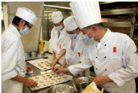
在廚房學習 西式食品製作